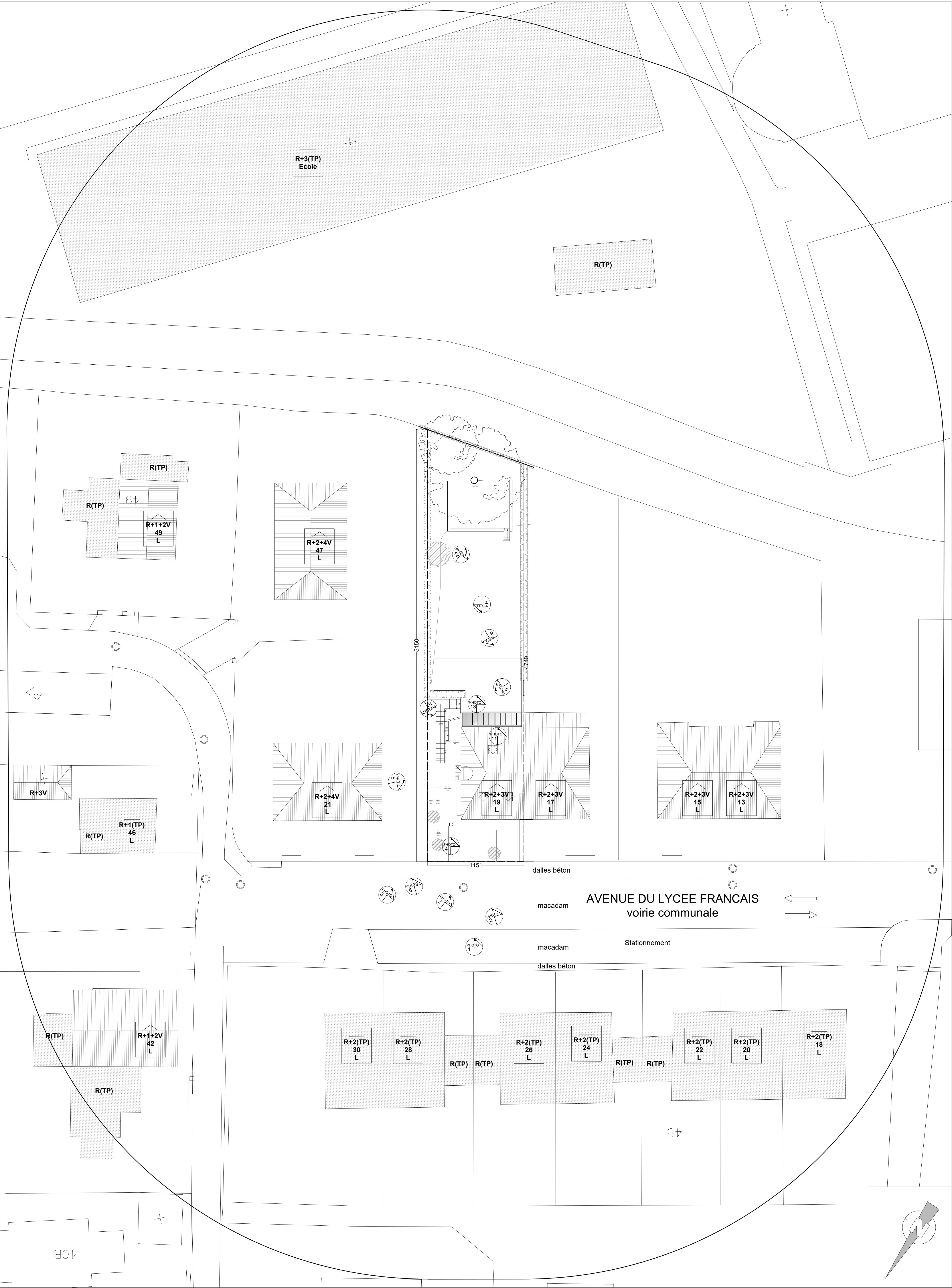
PLAN D'IMPLANTATION - ECH : 1/200